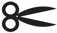
Illustration : Loïc Huguet

Au milieu du magazine, il y a 1 Paquet De Lessive Georges à Découper!